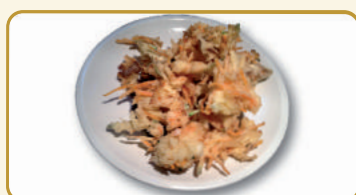
Menù Kaki age € 10,00 Menù Kaki age don € 10,00