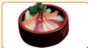
Menù Chirashi Misto € 12,00 Menù Chirashi Griglia € 13,00