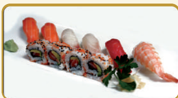
Menù Sushi € 12,00