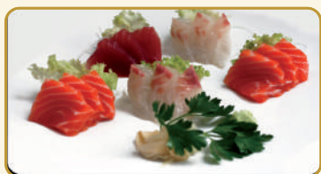
Menù Sashimi € 12,00