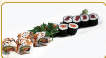
Menù Maki € 10,00 Menù Temaki € 10,00