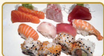
Menù Sushi e Sashimi mix € 12,00