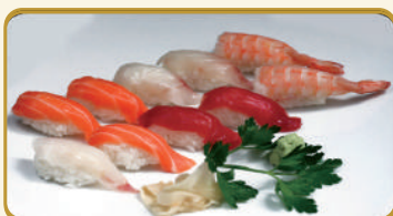
Menù Nighiri kisto € 12,00