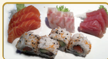
Menù Sashimi uramaki € 12,00