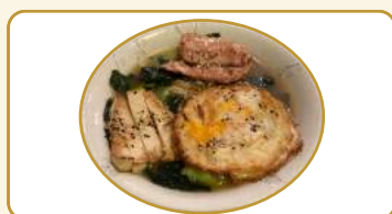
Menù ramen € 12,00