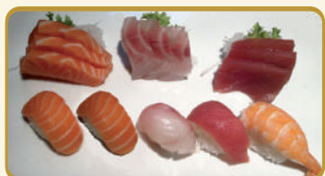
Menù Sushi e Sashimi € 12,00