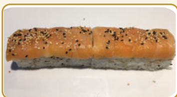
Menù Salmon grill roll € 12,00 Menù Miura roll € 10,00