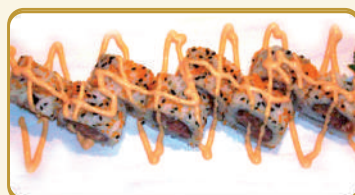
Menù Spicysalmon roll € 10,00 Menù Spicytuna roll € 12,00