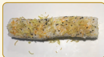
Menù Tuna cooked roll € 10,00