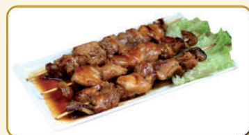
Menù Yaki Tori € 10,00 Menù Tori Teridon € 10,00