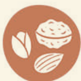
3. FRUTTA A GUSCIO