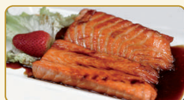
Menù Salmone Teri Yaki € 12,00