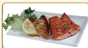
Menù pesce griglia € 12,00