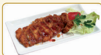
Menù Ton Catsu € 10,00 Menù Catsu Ton € 10,00