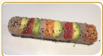
Menù Rainbow roll € 12,00