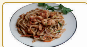
Menù Yaki Udon € 10,00 Menù Yaki Soba € 10,00