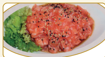
Menù tartar € 10,00