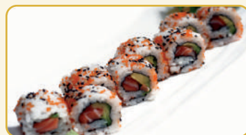
Menù Uramaki € 10,00 Menù Hossomaki € 10,00 Menù Uramaki a scelta €...