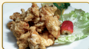
Menù Tori No Kara Age € 10,00