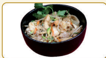
Menù Chuka Don € 10,00