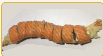
Menù Ebiten roll € 10,00 Menù Tiger roll € 12,00