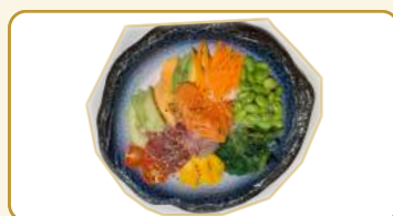
Menù poke pesce € 12,00