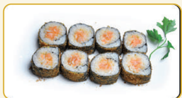
Menù Futomaki fritti € 12,00