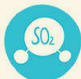
14. ANDRIDE SOLFOROSA O SOLFITI