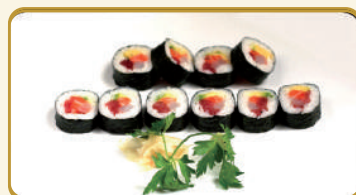
Menù Futomaki misto € 12,00