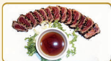
Menù Tataki maguro € 13,00 Menù Tataki shake € 12,00